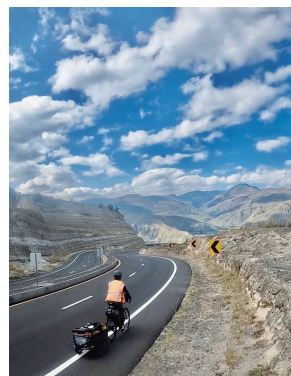
エクアドル、アンデス山脈を走る