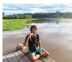
ブラジル、アマゾンで釣り