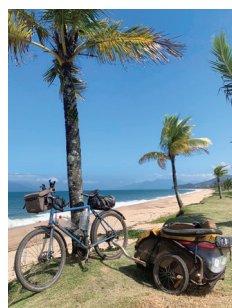
ブラジル、大西洋と共に